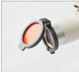
Sarı Filtre (Opsiyonel)