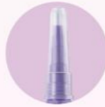
çok amaçlı besleme borusu konektörü