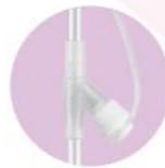
3 yollu İ laç eklemek veya tüpü temizlemek için kullanımı kolay