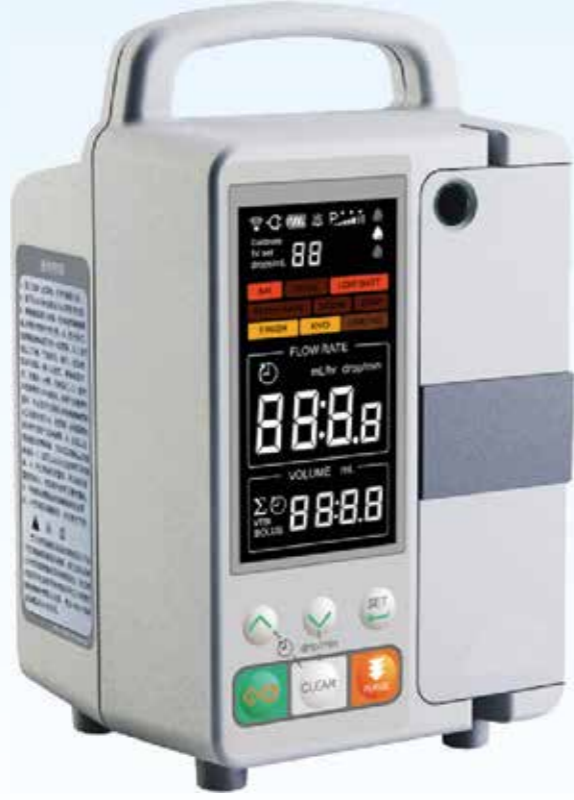
SEAMED KL - 8052N İnfüzyon Pompası